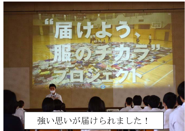
強い思いが届けられました！