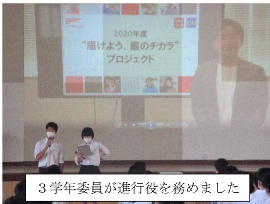
3学年委員が進行役を務めました

今年度は新型コロナウイルス感染拡大防止のため、街頭での服の回収活動はできませんが、伝統をつないでいくために各学年で啓発DVDを観ました。今後も継続し、さまざまな場面で社会貢献できる猿中生を目指していきます。