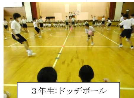
3 年生:ドッジボール