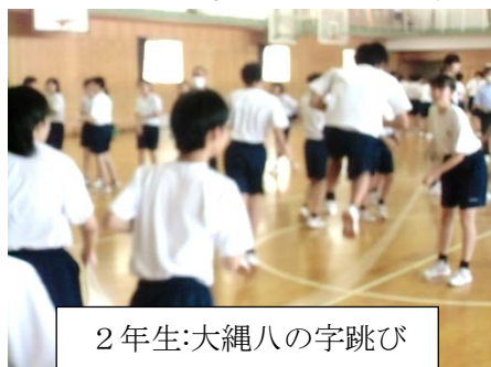
2 年生:大縄八の字跳び