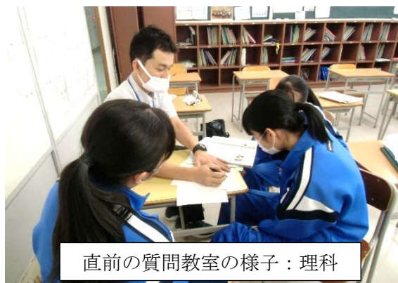
直前の質問教室の様子：理科

今年度1回目の定期テストを実施しました。当初の予定から3週間遅れとなりましたが、生徒一人ひとりが目標をしっかりともち、学習に取り組んでいました。返却後の点数に一喜一憂せず、「継続は力なり」を信じて今後も学習を積み上げていきましょう。