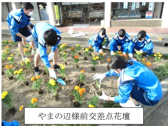
やまの辺様前交差点花壇

環境委員会が放課後、やまの辺前交差点花壇、玄関前プランター、中庭花壇にマリーゴールドの定植作業を行いました。黄色とオレンジ色の花がまぶしく輝いています。環境委員が当番活動で欠かさず水やりをし、世話をしています。