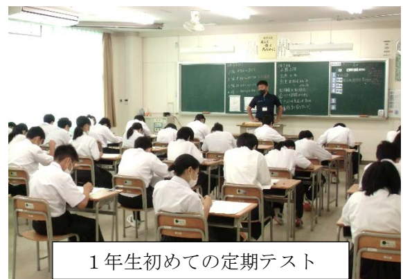
1年生初めての定期テスト