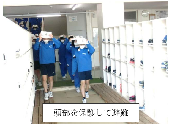
頭部を保護して避難